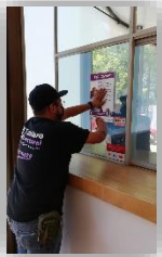
Central (Avenida Vallarta)