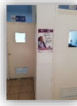
Consejo Municipal Guadalajara