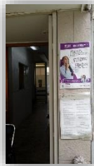
Central (Parque de las Estrellas)