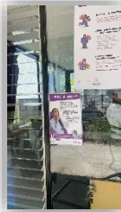
Central (López Cotilla)