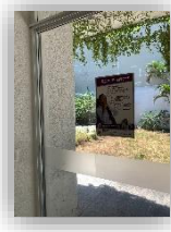
Consejo Municipal Zapopan